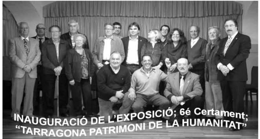
INAUGURACIÓ DE L'EXPOSICIÓ; 6é Certament; "TARRAGONA PATRIMONI DE LA HUMANITAT"