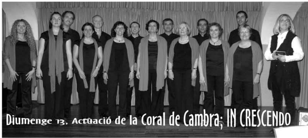
Diumenge 13, Actuació de la Coral de Cambra; IN CRESCENDO