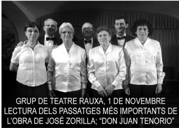
GRUP DE TEATRE RAUXA, 1 DE NOVEMBRE LECTURA DELS PASSATGES MÉS IMPORTANTS DE L'OBRA DE JOSÉ ZORILLA; "DON JUAN TENORIO"