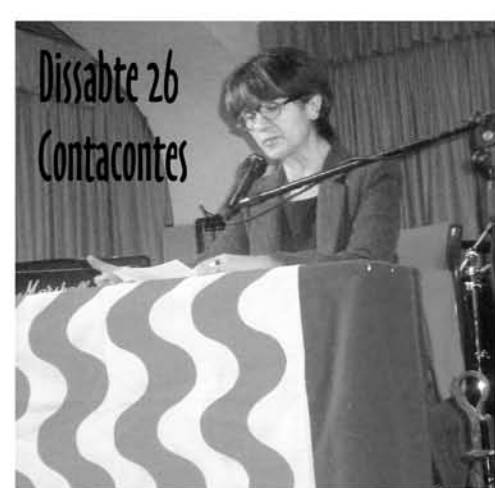
Dissabte 26 Contacontes