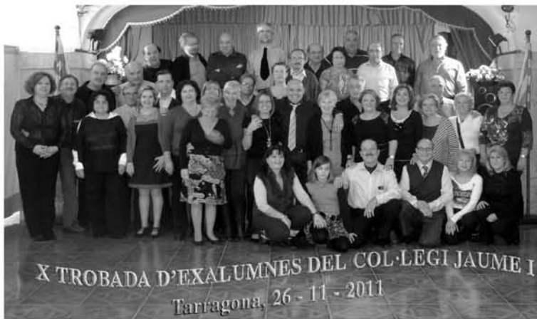
X TROBADA D'EXALUMNES DEL COL·LEGI JAUME I Tarragona, 26 - 11 - 2011