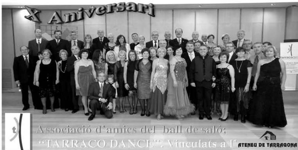
Associació d'amics del ball de saló; "TARRACO DANCE". Vinculats a l'ATENEU DE TARRAGONA