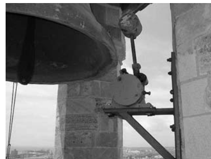
La campana la capona