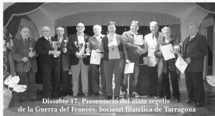
Dissabte 17, Presentació del mata segells de la Guerra del Francès. Societat filatèlica de Tarragona