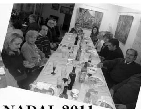
DINAR DE NADAL 2011