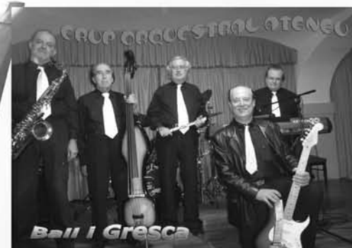
Ball i Gresca