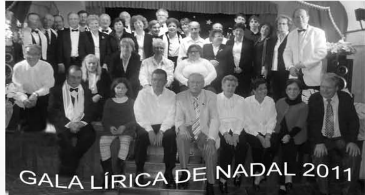
GALA LÍRICA DE NADAL 2011