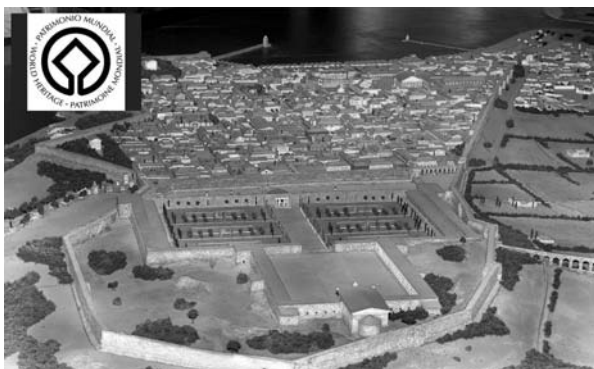
Maqueta de Tarraco, s. II d. C.