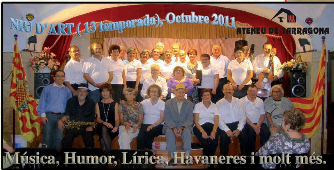
NIU D'ART (13 temporada), Octubre 2011