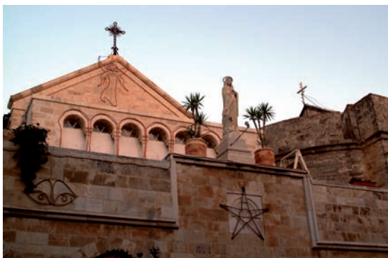
"ESGLÉSIA DEL NAIXEMENT", BETLEM